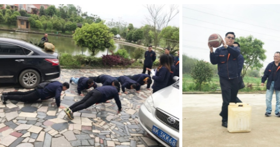
海川全体员工团建活动略图